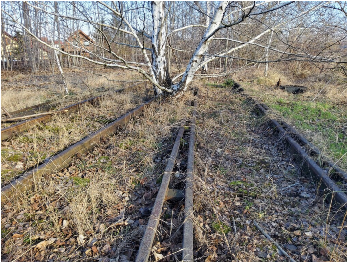
Bahnstrecken als Zubringer zu den Leunawerken - Im letzten Abschnitt südlich von Kötzschen sind die Spuren der Bahn im Gelände noch gut fassbar. Zwischen den Gleisen und der Weiche setzt sich heute die Natur durch. Blick nach Osten.