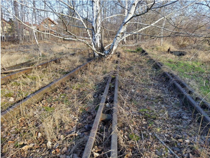
Bahnstrecken als Zubringer zu den Leunawerken - Im letzten Abschnitt südlich von Kötzschen sind die Spuren der Bahn im Gelände noch gut fassbar. Zwischen den Gleisen und der Weiche setzt sich heute die Natur durch. Blick nach Osten.