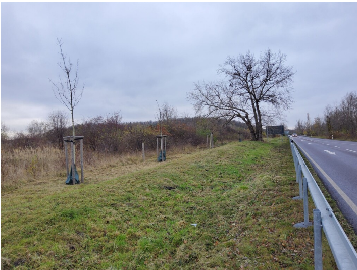
Bahnstrecke Beuna-Großkayna - Dammartige Erhebung neben der modernen Straße. Möglicherweise handelt es sich um einen Rest der Kohlebahn. Blick nach S.