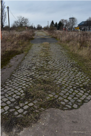
Alte Werkstraße - Die sogenannte "Alte Werkstraße" weist stellenweise noch die alte Pflasterung auf. Obwohl sie bereits lange vor den Beunaer Kohlenwerken bestand, diente sie sicherlich als Zuwegung zur Fabrik.