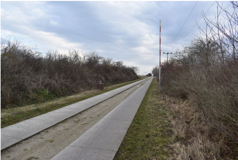
Kohlebahn Grube Elise II - Heute wird der ehemalige Bahnstreckenverlauf als Fahrrad und Wirtschaftsweg genutzt. Vielleicht ist die Schranke noch ein Restbestand.