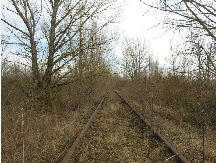
Weißenfelsener Bahn - Bahndamm mit Gleis im Bereich der Tagesanlagen Roßbach; Blick Ost