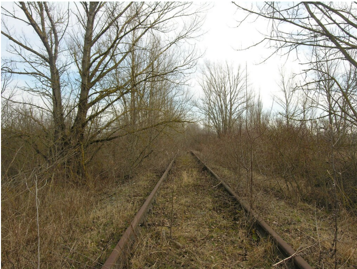
Weißenfelsener Bahn - Bahndamm mit Gleis im Bereich der Tagesanlagen Roßbach; Blick Ost