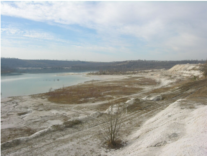
Tagebau Roßbach-Süd - Restloch des Tagebaus Roßbach-Ostfeld, nachträglicher Abbau von Kaolinton; Blick NW