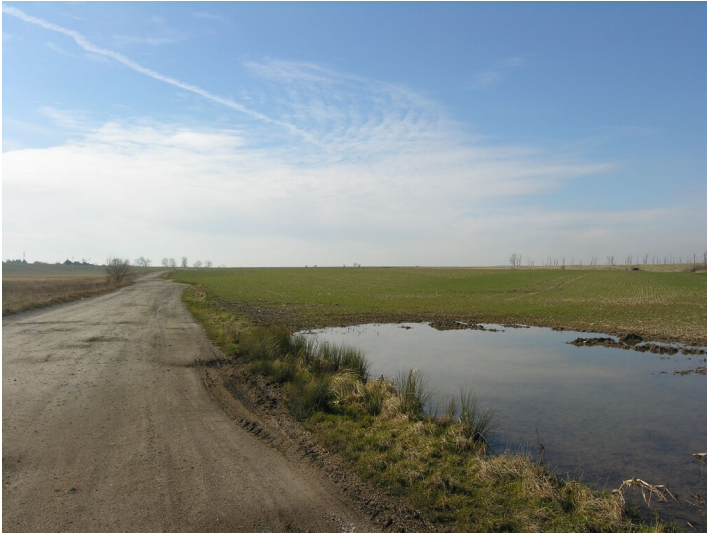
Abraumbahn - zwischen Tagebau Roßbach-Süd und Hochkippe; Blick West