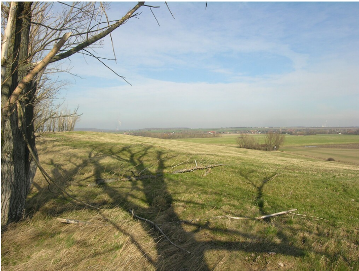
Grube Gute Hoffnung - Blick von der Kippe, über den ehemaligen Tagebau Nordfeld, nach Roßbach

Schlagwörter: Tagebau Fachsicht(en): Denkmalpflege Gemeinde(n): Braunsbedra Kreis(e): Saalekreis Bundesland: Sachsen-Anhalt