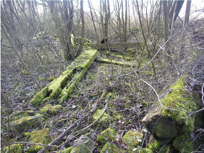
Trasse einer Kohlebahn - Bahnschwellen