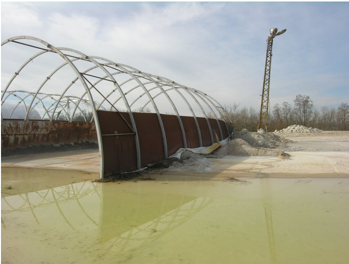
Kaolinwerk Roßbach - Werksgelände des Kaolin- und Tonwerkes