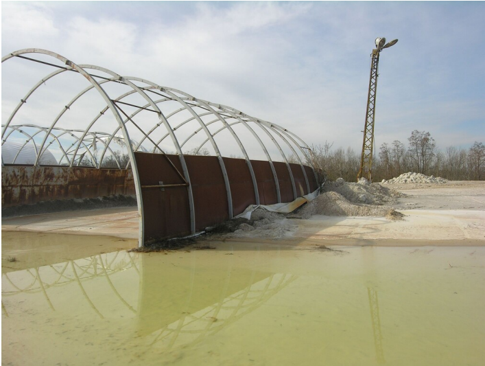
Kaolinwerk Roßbach - Werksgelände des Kaolin- und Tonwerkes