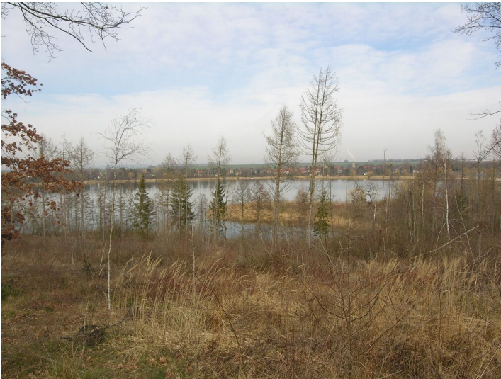
Tagebau Roßbach-Nord - der Hassensee; Blick NE

Schlagwörter: Tagebau Fachsicht(en): Denkmalpflege Gemeinde(n): Braunsbedra Kreis(e): Saalekreis Bundesland: Sachsen-Anhalt