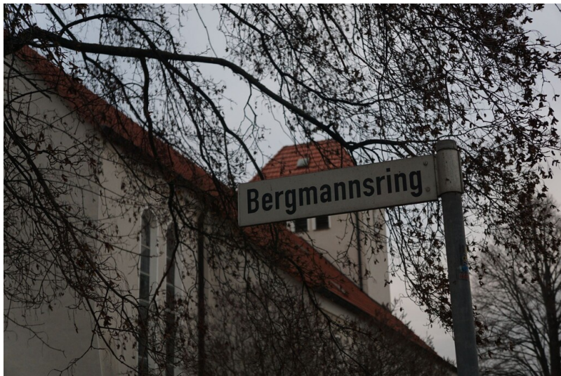
Straßenname Bergmannsring - Straßenschild Bergmannsring