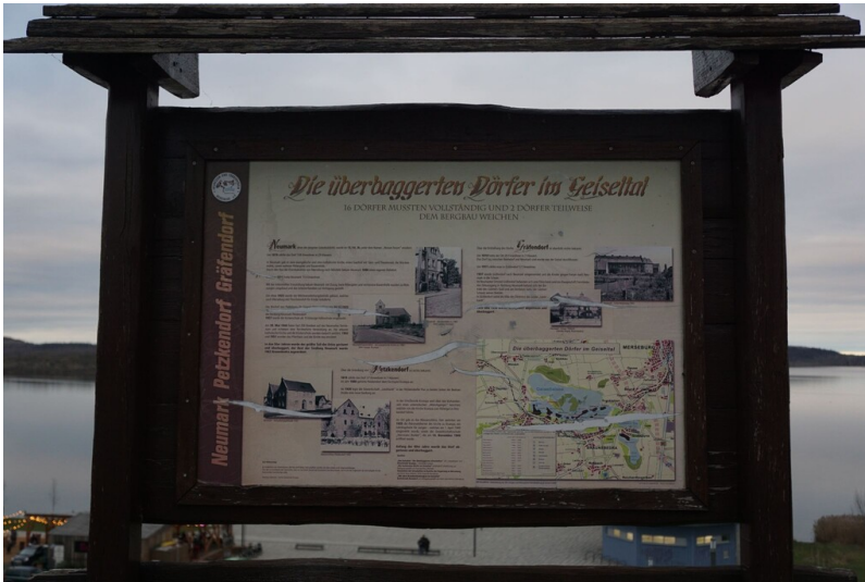
Devastierter Ort Petzkendorf - Informationstafel zu den devastierten Orten Petzkendorf, Neumark und Gräfendorf am Geiseltalsee.