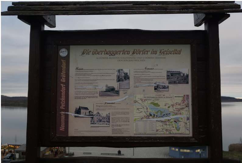
Devastierter Ort Gräfendorf - Informationstafel zu den devastierten Orten Petzkendorf, Neumark und Gräfendorf am Geiseltalsee.