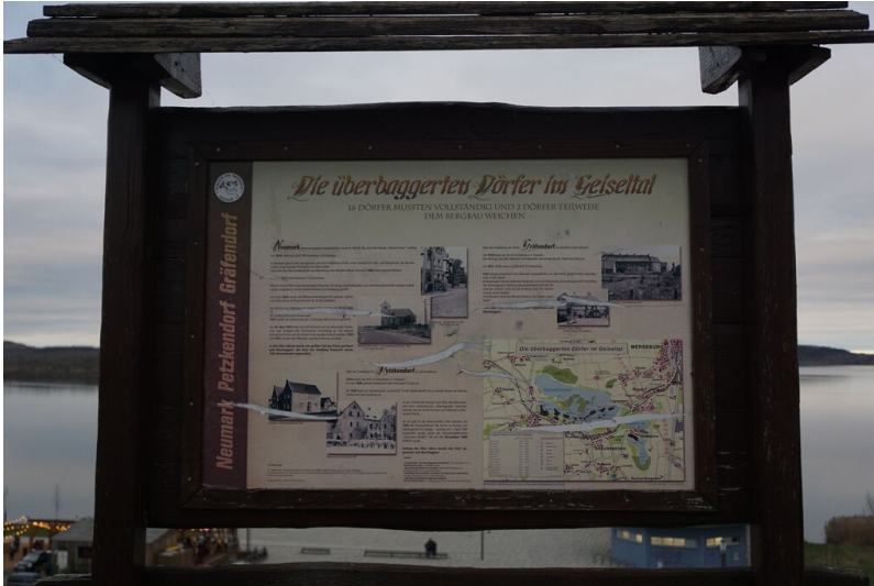
Devastierter Ort Gräfendorf - Informationstafel zu den devastierten Orten Petzkendorf, Neumark und Gräfendorf am Geiseltalsee.