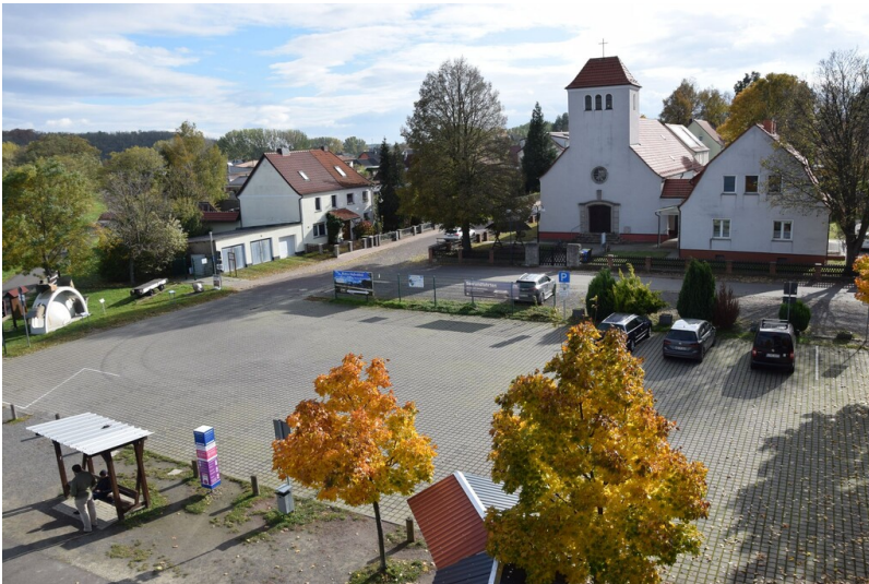
katholische Kirche St. Heinrich - Blick vom Aussichtsturm "Leonhardt" auf Kirche und Pfarrhaus