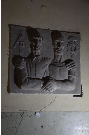
Kulturhaus "Ernst Thälmann" Krumpa - Im Eingangsbereich