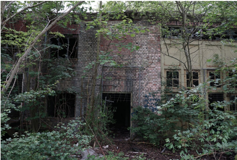
Elektrizitätszentrale des Mineralölwerkes Lützkendorf - Zustand am 24.05.2020