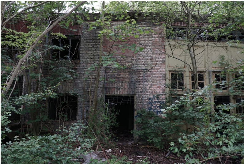
Elektrizitätszentrale des Mineralölwerkes Lützkendorf - Zustand am 24.05.2020