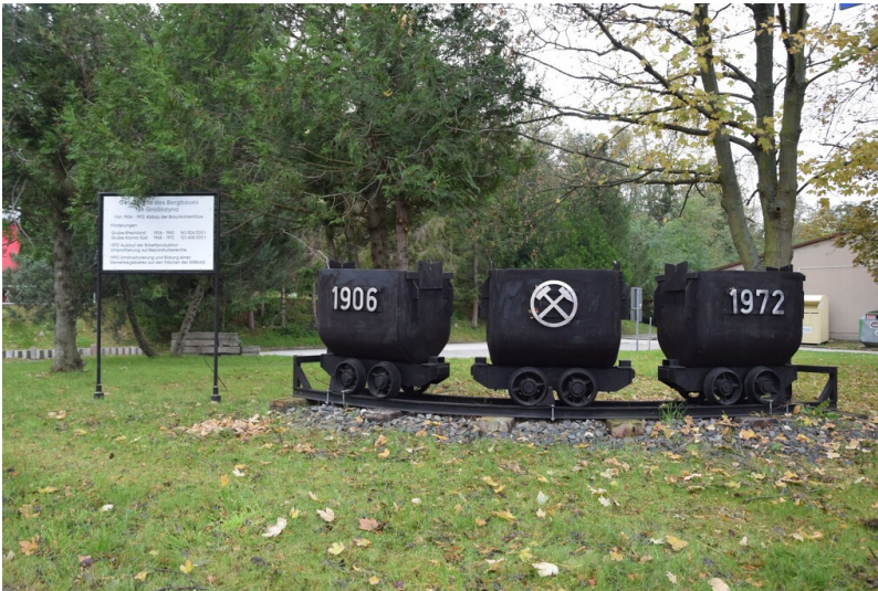
Gedenkstätte Braunkohlenabbau in Großkayna - Grubenhunte

Schlagwörter: Gedenkstätte Fachsicht(en): Denkmalpflege Gemeinde(n): Braunsbedra Kreis(e): Saalekreis Bundesland: Sachsen-Anhalt