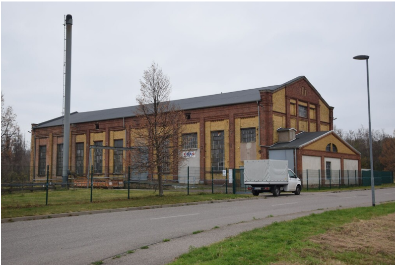
Werkstattgebäude des Standortes der Brikettfabriken Michel und Vesta - Blick vom Michel-Vesta-Ring aus nördlicher Richtung auf das Gebäude