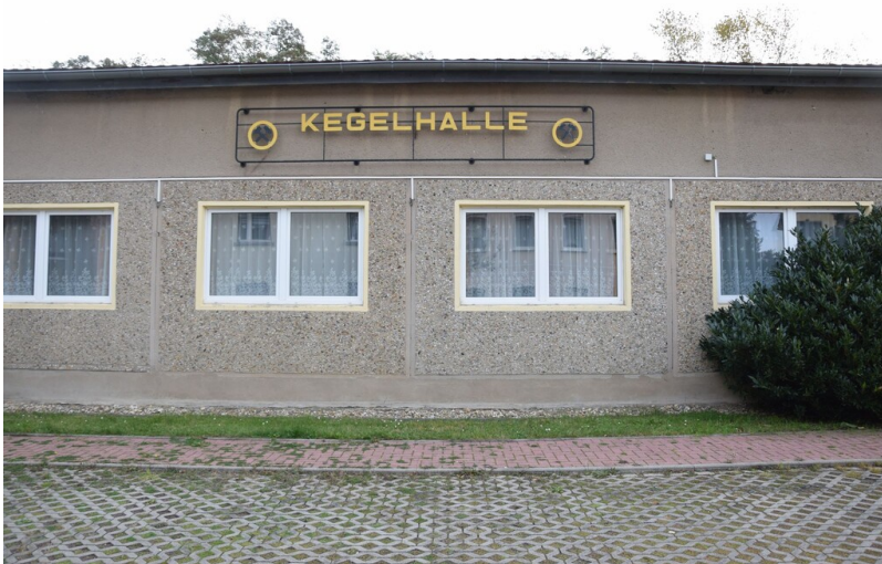
Kegelbahn Großkayna - Fassadendetail