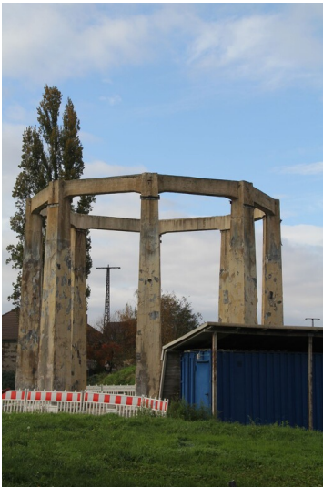
Relikt eines Wasserturms - Betonskelett eines Wasser- oder Kühlturms