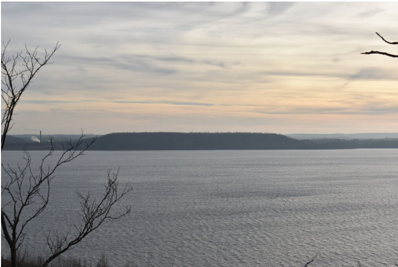
Halde Pfännerhall - Blick auf die Halde Pfännerhall von der Halde Blösien aus.

Schlagwörter: Abraumhalde Fachsicht(en): Denkmalpflege Gemeinde(n): Braunsbedra Kreis(e): Saalekreis Bundesland: Sachsen-Anhalt