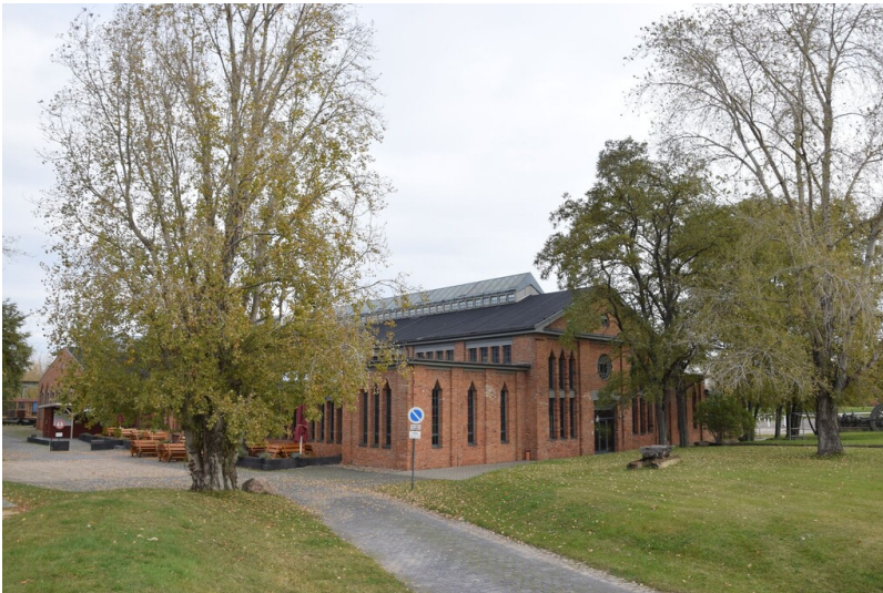
Zentralwerkstatt der Grube und Brikettfabrik Pfännerhall - Blick Richtung Nordosten auf die Zentralwerkstatt