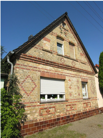
Wohnhaus (um 1920)