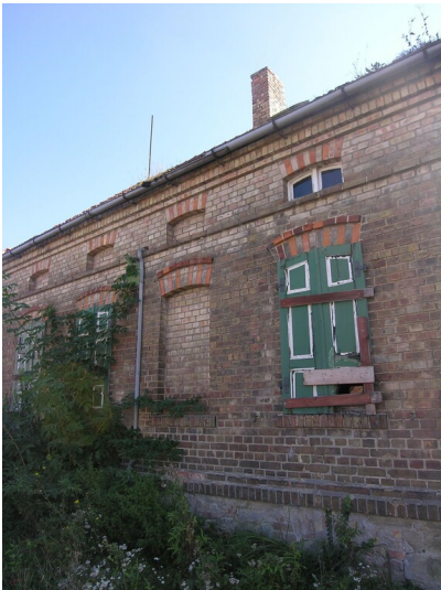
Wohnhaus (um 1900)