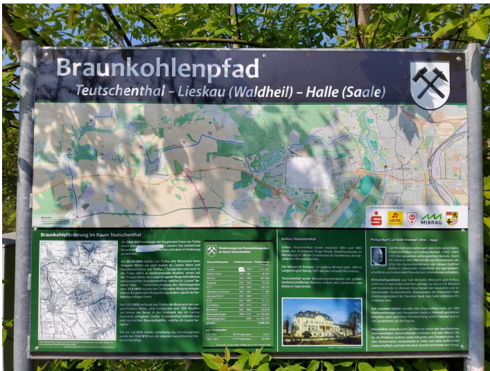
Beginn des Braunkohlenpfades

Schlagwörter: Braunkohle Fachsicht(en): Denkmalpflege Gemeinde(n): Teutschenthal Kreis(e): Saalekreis Bundesland: Sachsen-Anhalt