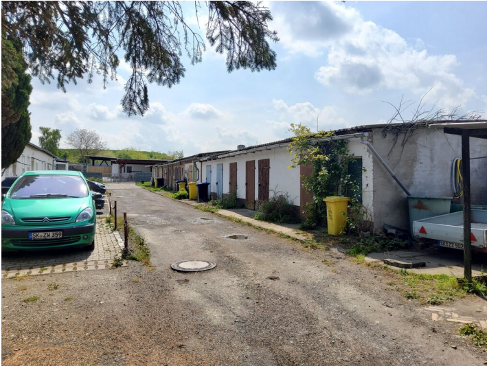
Nebengebäude der Grube Louise - Nebengebäude Steigerhaus, ehemaliger Stall und Waschhaus