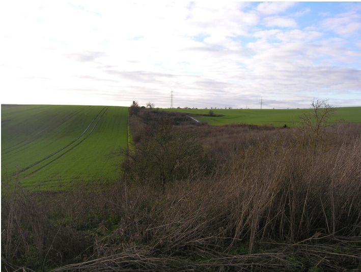
Kohlebahn von der Grube Stedten zum Kalkofen - ehemaliger Förderschacht und Trasse einer Kohlebahn; Blick N