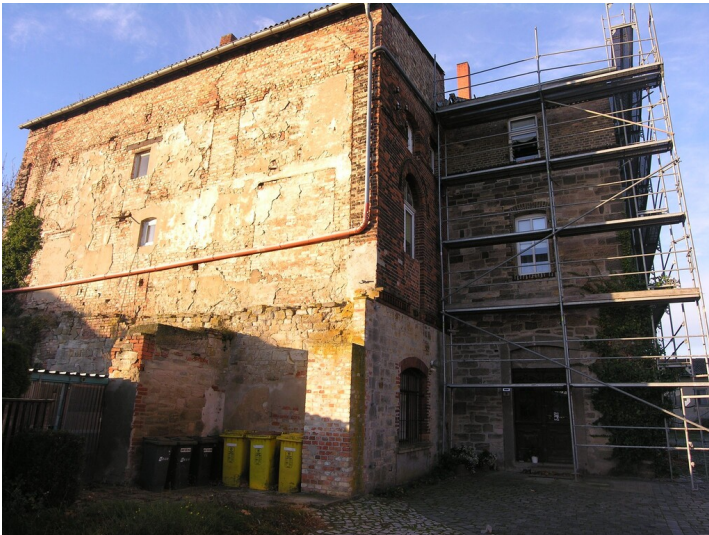
Verwaltungsgebäude der Zuckerfabrik Schwittersdorf - Ein erhaltenes Fabrikgebäude, vermutlich der Verwaltungstrakt.