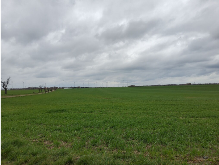
Grube Auguste - Blick von Süden auf die Grube Auguste und die Obstbaumallee nach Schwittersdorf