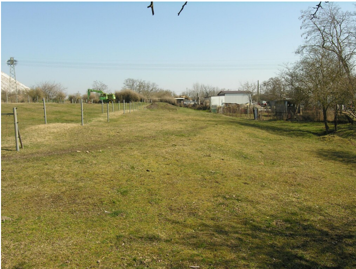
Schwelerei Klotz (nach 1872-vor 1903) - das ehemalige Fabrikgelände; Blick E