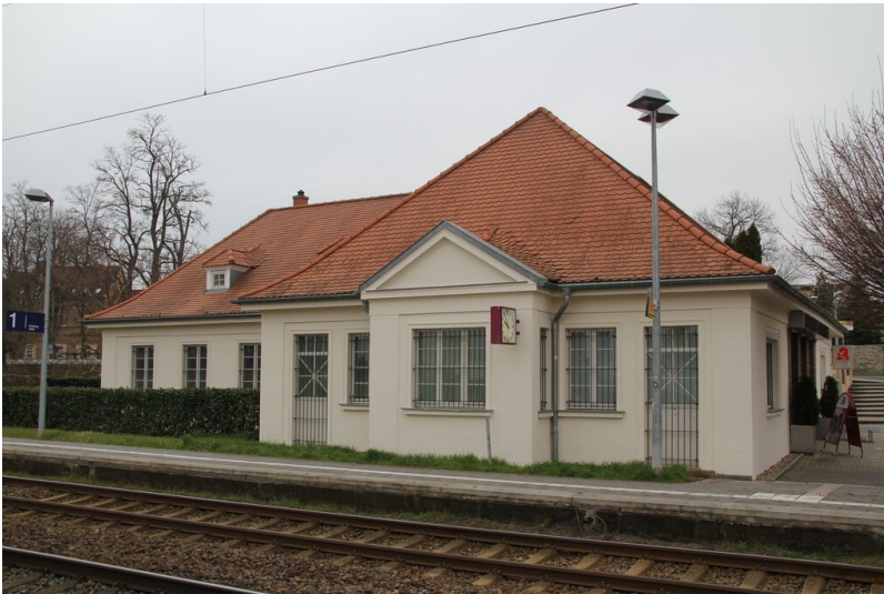
Bahnhof Wansleben am See - Ansicht gleisseitig