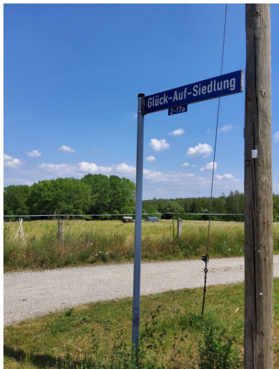
Straßenname Glück-Auf-Siedlung - NO-Ecke der Siedlung, in der Sichtachse zwischen Schild und Mast liegt am Waldrand die Grube Heinrich Richard