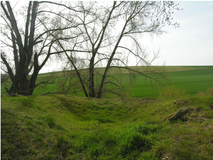
Standort der Nasspresse Grube Laura - Situation der ehemaligen Nasspresse Grube Laura; Feld im Mittelgrund; Blick von der Kippe in Richtung Süd.