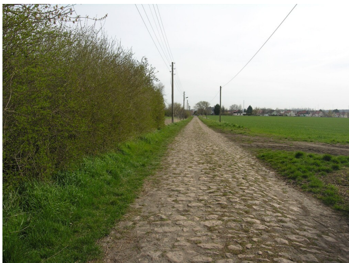
Werkstraße Lauraweg - Lauraweg nach Röblingen