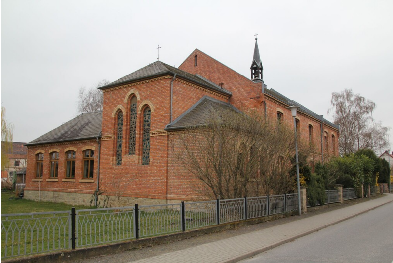
Katholische Kirche St. Anna - Gesamtansicht straßenseitig