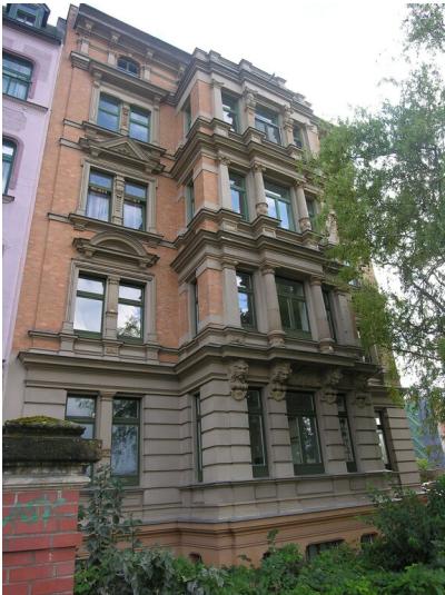
Handelslager und Comptoir