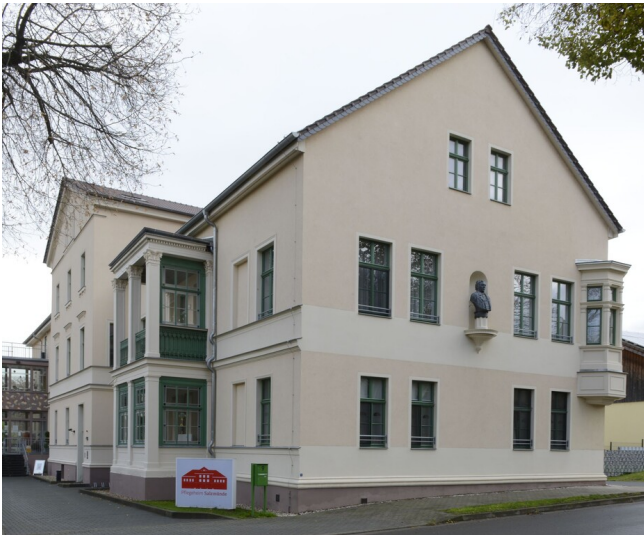
Wohnhaus Johann Gottfried Boltze

Schlagwörter: Wohnhaus Fachsicht(en): Denkmalpflege Gemeinde(n): Salzatal Kreis(e): Saalekreis Bundesland: Sachsen-Anhalt