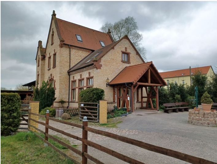
Bahnhof Salzmünde - Bahnhofsgebäude, heute zum Wohnhaus mit Praxis umgenutzt