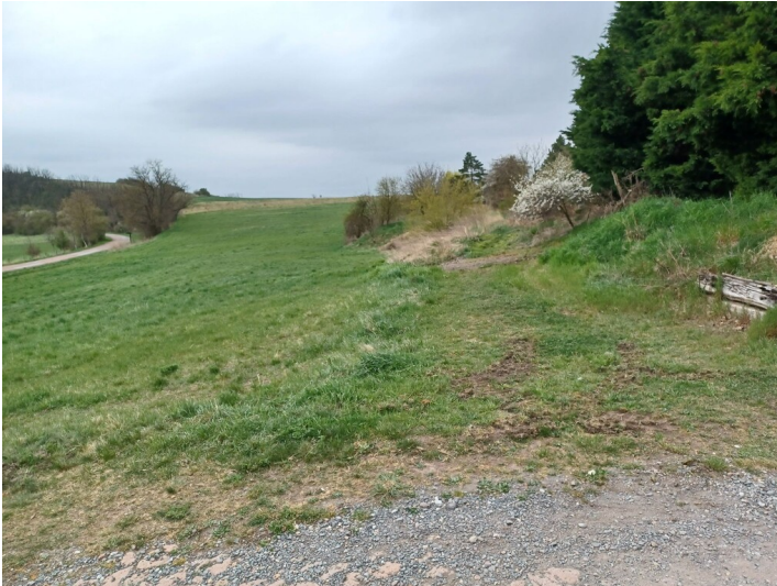
Bahnstrecke Teutschenthal-Salzmünde - Blick entlang der ehemaligen Trasse in Richtung Süden auf Höhe des Thaleweges in Zappendorf