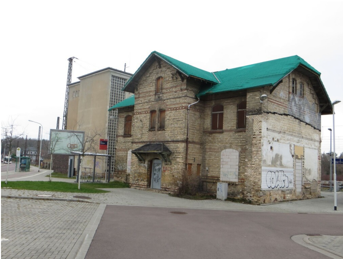
Bahnhof Nietleben