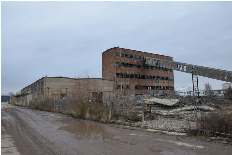
Plattenwerk Halle-Neustadt - Hauptansicht