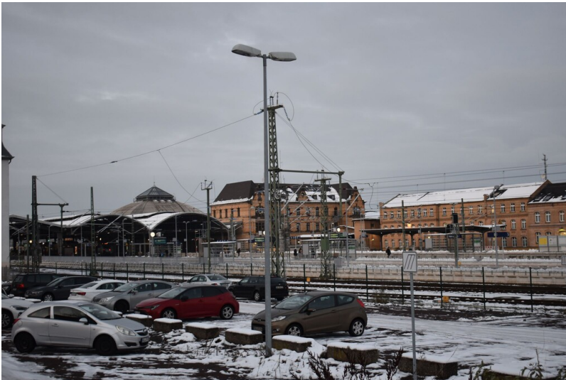
Reichsbahnamt Halle (Saale) - Straßenansicht des ehemaligen Reichsbahnamts