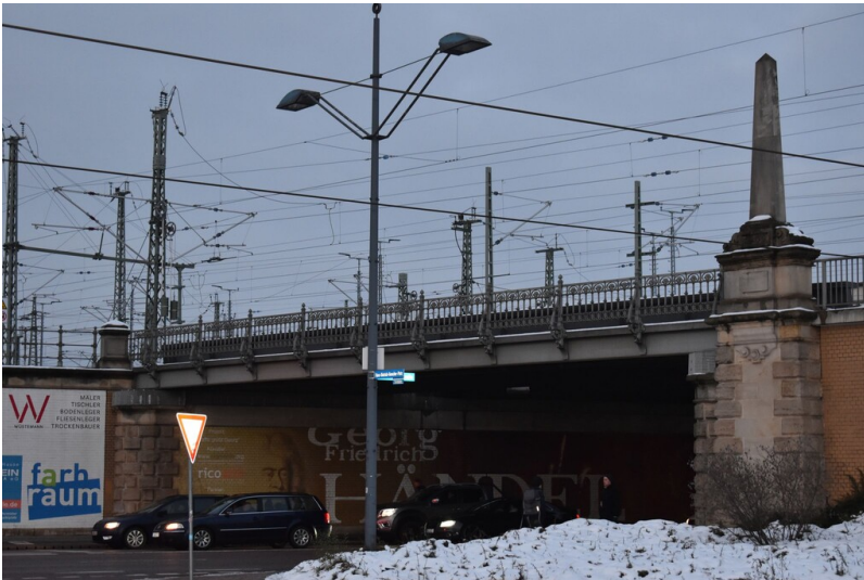
Eisenbahnbrücke am Hauptbahnhof Halle (Saale) - Ansicht der Eisenbahnbrücke am Hauptbahnhof