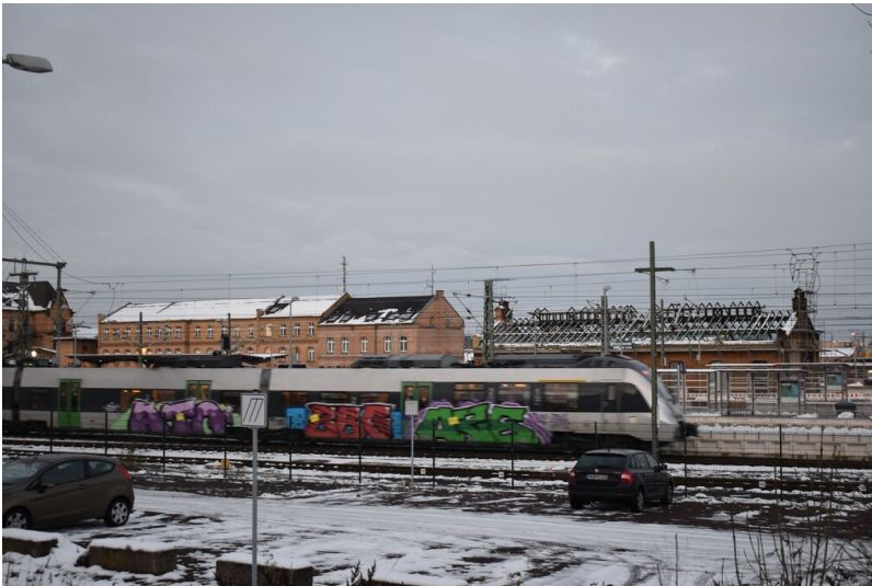
Wasserturm am Hauptbahnhof - Ansicht des Wasserturms von den Gleisanlagen