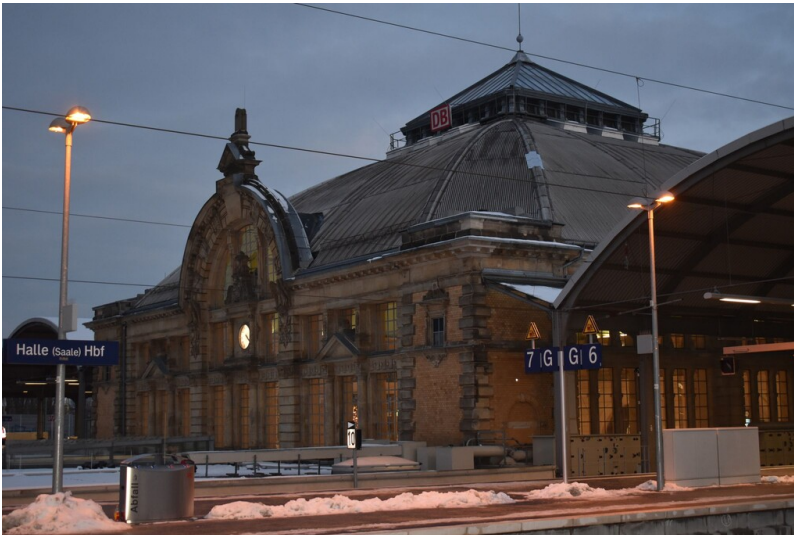
Hauptbahnhof Halle Saale - Ansicht des Haupteingangs vom Hauptbahnhof Halle (Saale) von den Gleisanlagen