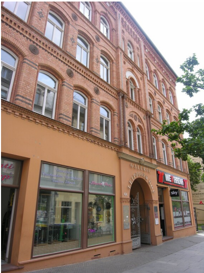
Wohn- und Geschäftshaus Kobe (um 1880) - Wohnhaus in der Leipziger Straße Nr. 64