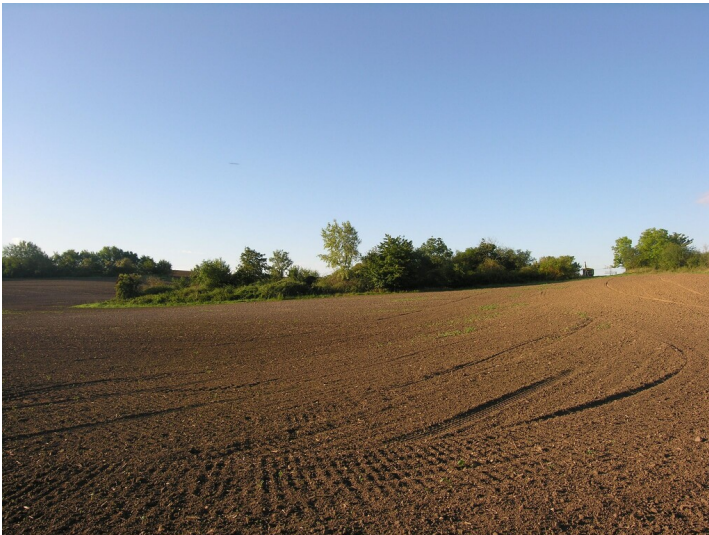
Verladestation mit Gleisanschluss (vor 1904-1913)