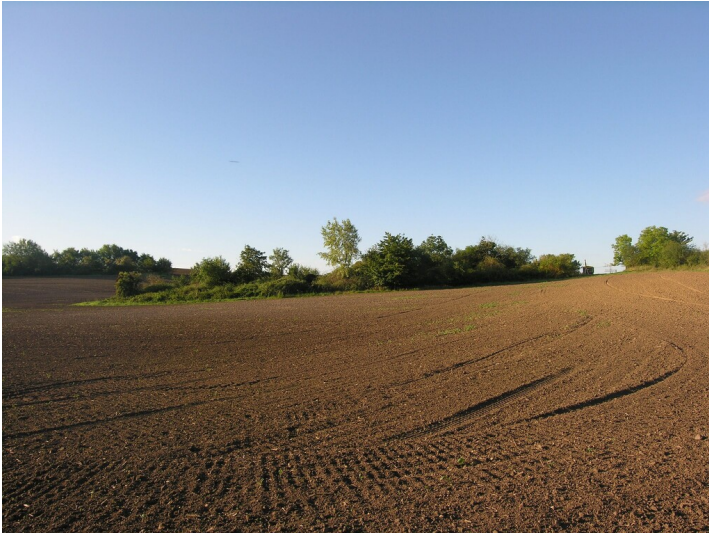
Verladestation mit Gleisanschluss (vor 1904-1913)