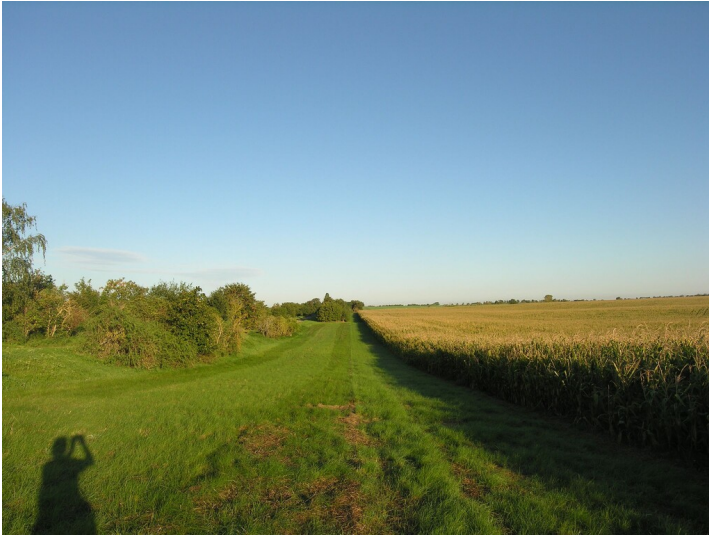
Bruchfeld der Grube Alt-Zscherben (1864-1944) - am Bennstedter Weg; Blick N