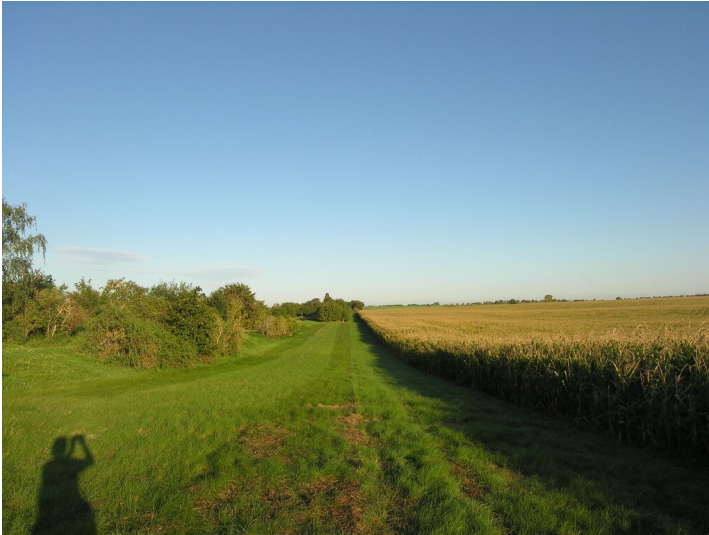
Bruchfeld der Grube Alt-Zscherben (1864-1944) - am Bannstedter Weg; Blick N