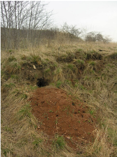
Aschehalde der Schwelerei Grube Louise (1877-1924) - Bodenaufschluss mit Asche, an der Haldenböschung; Blick SE