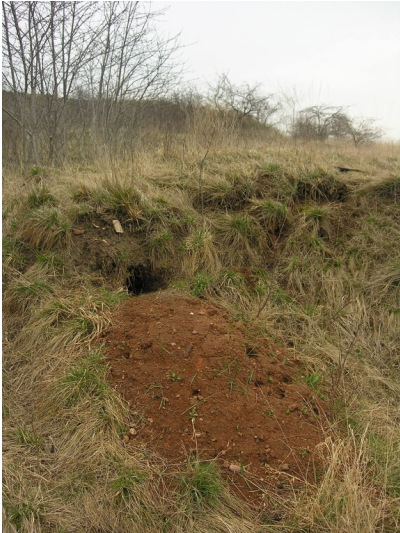
Aschehalde der Schwelerei Grube Louise (1877-1924) - Bodenaufschluss mit Asche, an der Haldenböschung; Blick SE